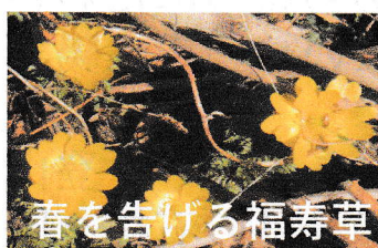
春を告げる福寿草